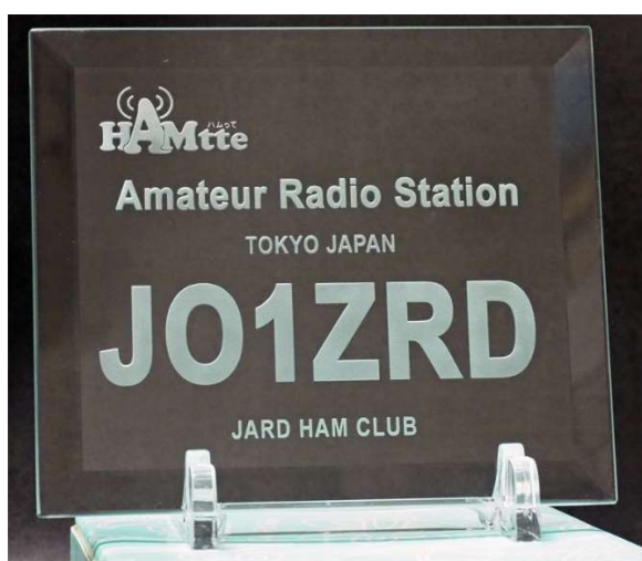
特製コールサインプレートの見本

※HAMtte メンバーとの交信が1局も記載されていない書類を提出された場合は、20局参加賞、賞品抽選権の対象となりません